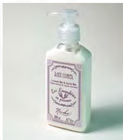
LAIT CORPS / BODY MILK

This 100% natural massage oil helps smoothing your skin and relaxing muscle tensions.