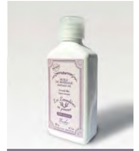
HUILE DE MASSAGE / MASSAGE OIL

Scented bath salts made from organic essential oil of true lavender, locally grown in Provence.