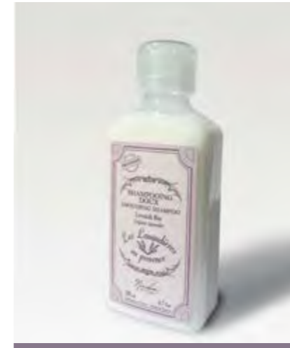
SHAMPOING / SHAMPOO

Nicolosi Creations keeps on enlarging its skin-care range and elaborating new formulas always from locally grown organic true lavender !