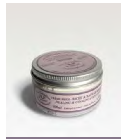
CRÈME PIEDS / FOOT CREAM

Gently exfoliates the skin thanks to the entire lavender flowers included in the soap.