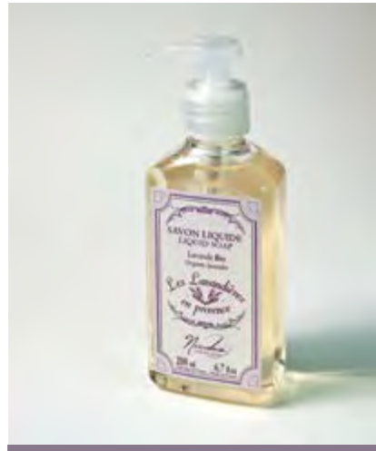
SAVON LIQUIDE / LIQUID SOAP

Nettoie vos mains sans les dessécher. Cleans your hands without drying them out.