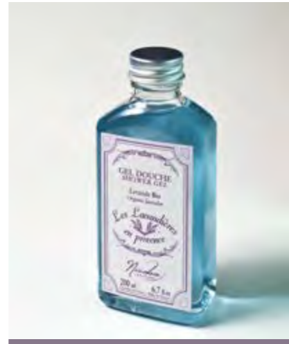
GEL DOUCHE / SHOWER GEL

Nettoie vos mains sans les dessécher. Cleans your hands without drying them out.