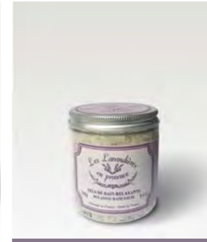
SELS DE BAINS / SCENTED BATH SALTS

Great for dry and lifeless hair. The conditioner included also helps detangle the hair.