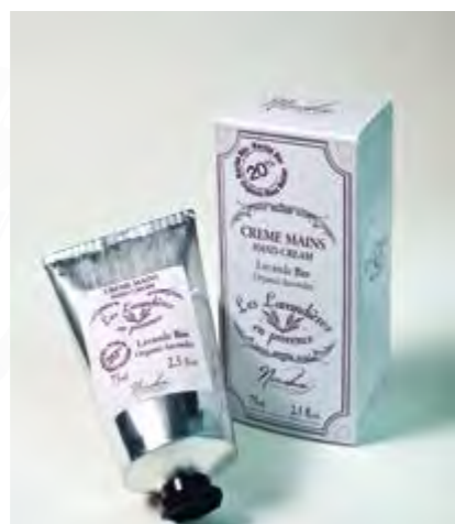
CRÈME MAINS / HAND CREAM

Protects your skin from the effects of the cold during the winter, freshens you up during the summer.