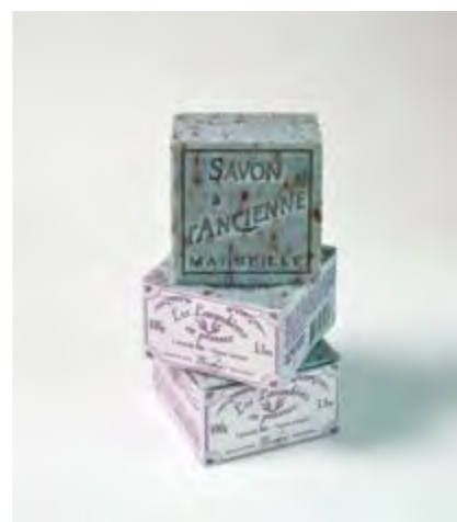
SAVON LAVANDE / LAVENDER SOAP

Enriched in organic shea butter (20%). Great for dry, cracked hands. Non greasy.